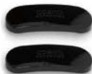
2 Basismagnete zu Cosmo Moto, schwarz glänzend. Artikel Nummer 2004554