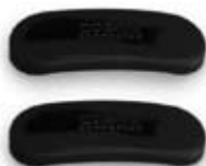
2 Basismagnete zu Cosmo Moto, schwarz matt. Artikel Nummer 2004555