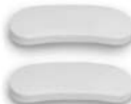
2 Basismagnete zu Cosmo Moto, weiss glänzend. Artikel Nummer 2004556